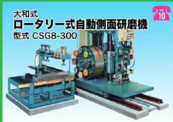
大和式 ロータリー式自動側面研磨機 型式 CSGR-300