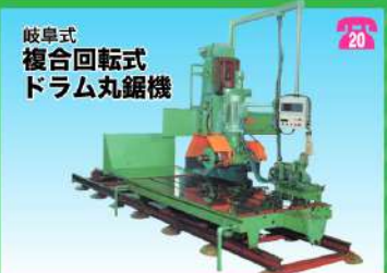
岐阜式 複合回転式 ドラム丸鋸機