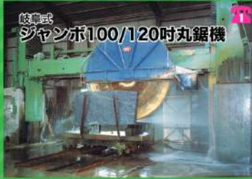
岐阜式 ジャンボ100/120吋丸鋸機

お買得中古品がいっぱい。ご予約はお早めに！ 電話でのご予約も承ります。お問い合わせは FAXで 023-642-3619