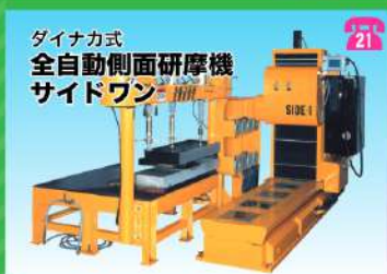
ダイナカ式 全自動側面研磨機 サイドワン