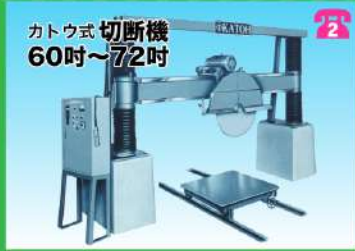
カトウ式 切断機 60吋～72吋