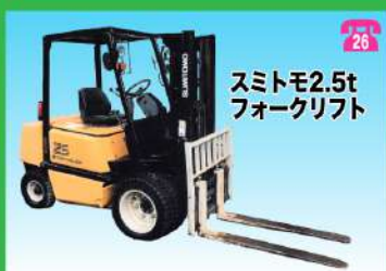
スミトモ2.5t フォークリフト