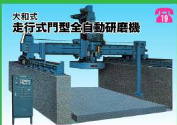
大和式 走行式門型全自動研磨機