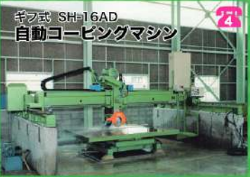
キブ式 SH-16AD 自動コーピングマシン