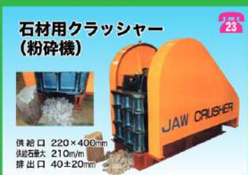
石材用クラッシャー (粉碎機)

供給口 220×400mm 供給容量 210m 3 /h 排出口 40±20mm