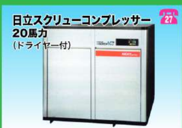
日立スクルーコンプレッサー 20馬力 (ドライヤー付)