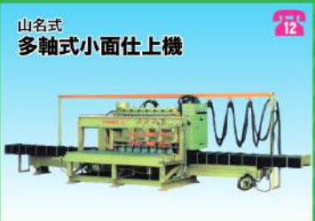
山名式 多軸式小面仕上機