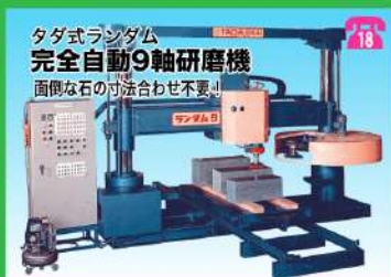
タダランダム 完全自動9軸研磨機 面倒な石の寸法合わせ不要!