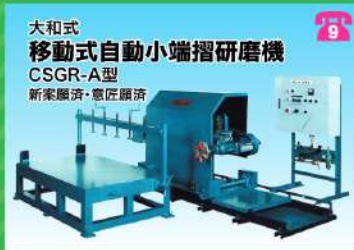
大和式 移動式自動小端摺研磨機 CSGR-A型 新家販済・意匠願済