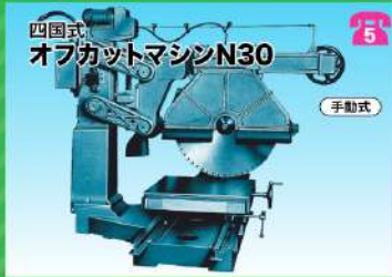
四国式 オフカットマシンN30 手動式