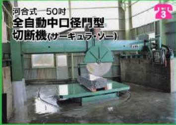
河合式 50吋 全自動中口径門型 切断機(サーキュラ・ソー)