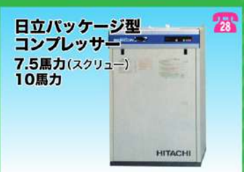
日立パッケージ型 コンプレッサー 7.5馬力(スクルー) 10馬力