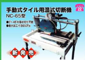
手動式タイル用湿式切断機 NC-65型 ●0～45度の微切り可能 ●最大加工寸法650mm