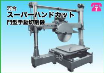
河合 スーパーハンドカット 門型手動切削機