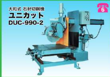
大和式 石材切削機 ユニカット DUC-990-2