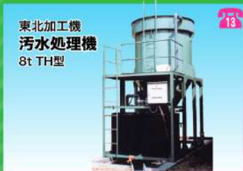
東北加工機 汚水処理機 8t TH型