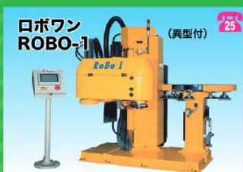
ロボワン ROBO-1 (典型付)