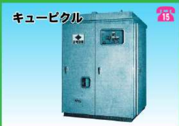
キュービカル 小型側面研磨機