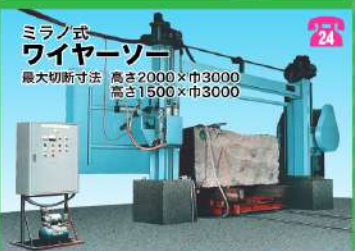
ミラノ式 ワイヤソー 最大切断寸法 高さ2000×巾3000 高さ1500×巾3000

供給口 220×400mm 供給容量 210m 3 /h 排出口 40±20mm