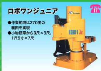
ロボワンジュニア ●作業範囲は270度の範囲を実現 ●小物研磨から3尺×3尺、1尺5寸×7尺