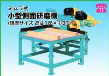
ミムラ式 小型側面研磨機 (研磨サイズ 高さ1尺×巾3尺)