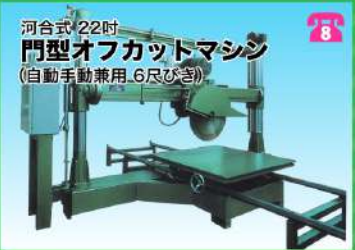
河合式 22吋 門型オフカットマシン (自動手動兼用 6尺びき)