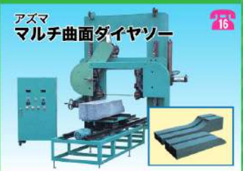
アズマ マルチ曲面ダイヤソー